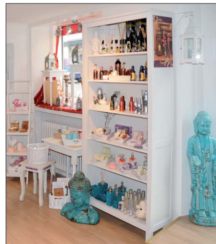
Viele Dekorationsartikel und Geschenkideen