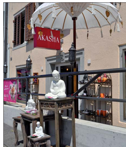
Ein Platz an der Sonne: Buddhas vor dem Akasha